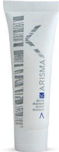
KRDS30T - 30 ml