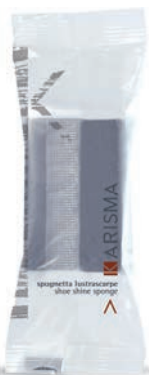
KRSLFP - Flowpack