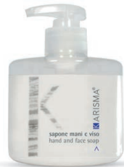
KRSM300F - 300 ml

سوف تغلفك المكونات المكونة من الياسمين واليبلنج في جو ساحر، وتتنظف فروة الرأس والشعر بلطف.