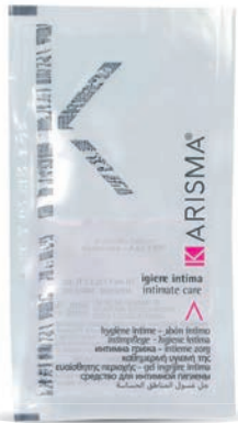
KRIG10 - 10 ml