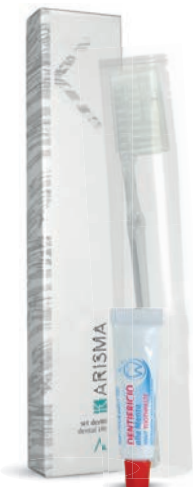
KRSD - Box

تتألف من فرشاة أسنان يغطاه شعيرات وأنيوب 100% صنع في إيطاليا معجون أسنان من إنتاج مصانعنا