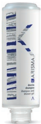
KRDS300C - 300 ml