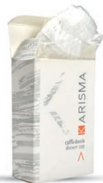
KRC DAS - 2 - Box

AR - قبعة الاستحمام ملحق لا غنى عنه وضروري للغاية ومحافظ بعلبة مريحة