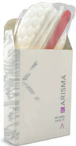
KRSV-P - Box

تتألف من أزرار وديوس أمان وإبرة وخيوط بألوان مختلفة