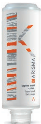
KRSM300C - 300 ml

ينظف بلطف مع مراعاة التوازن الطبيعي للبشرة، مما يساعدها على الحفاظ على الترطيب والتعومة الأمثل. تركيب ماكسي مناسب وينقل من النفايات البلاستيكية.