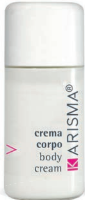
KRCC20F - 20 ml