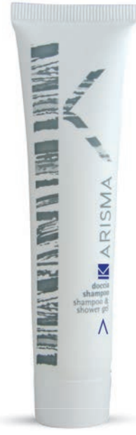
KRDS40T - 40 ml