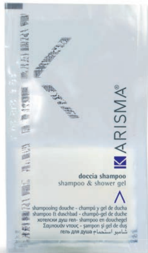
KRDS10 - 10 ml

AR - مامت سالا وبماش سوف تنظف المكونات المكرة من الياسمين والإيلنج في جو ساحر، وتنظف فروة الرأس والشعر بلطف.