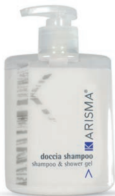
KRDS500F - 500 ml