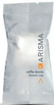
KRCDFP - Flowpack

AR - إسفنجة مبللة يدويًا لتلميع سريع وعملي