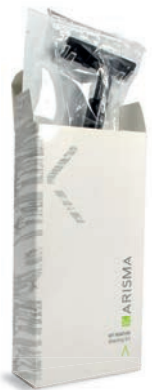
KRSR - Box