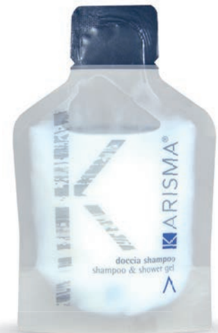
KRDS30 - 30 ml