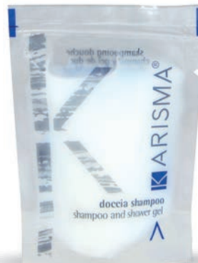
KRDS20 - 20 ml