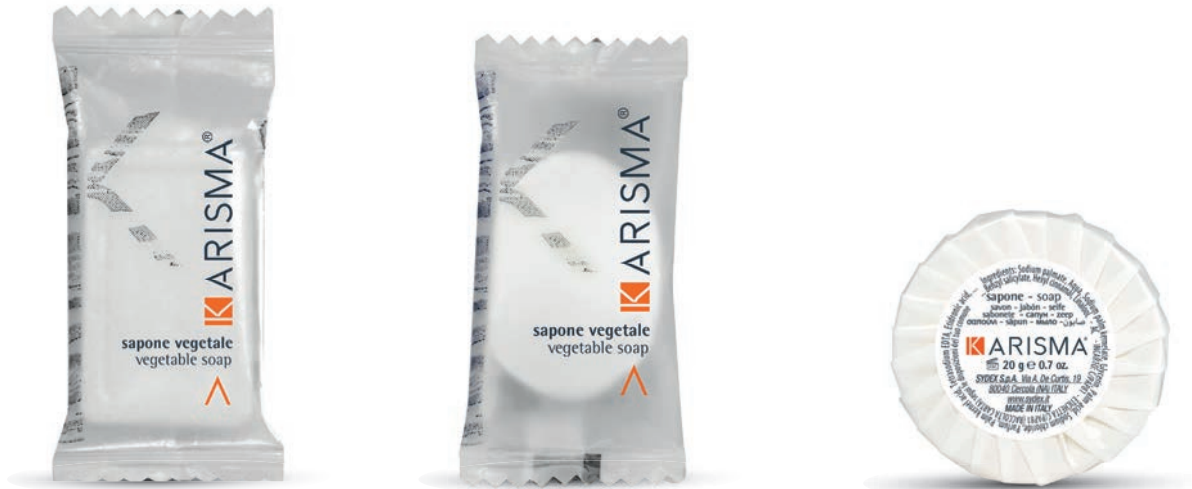
KRSR14FP - 14 g

مصنوع فقط من مواد خام مشتقة من أصل نباتي، بدون استخدام مبيضات كيميائية، حيث أنه غني بالجلسرين الذي له خصائص مطرية، الذي يرطب البشرة ويحميها بلطف