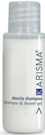
KRDS30F - 30 ml