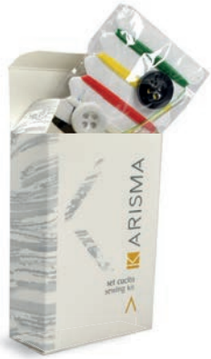
KRSC - Box