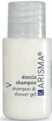
KRDS20F - 20 ml

AR - مامجت سالا وبماش سوف تغلفك المكونات المكرة من الياسمين والإيلنج في جو ساحر، وتنظف فروة الرأس والشعر بلطف