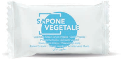
9 g WHS09FP