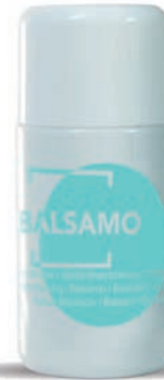
20 ml - 0.68 fl.oz. WHBL20F