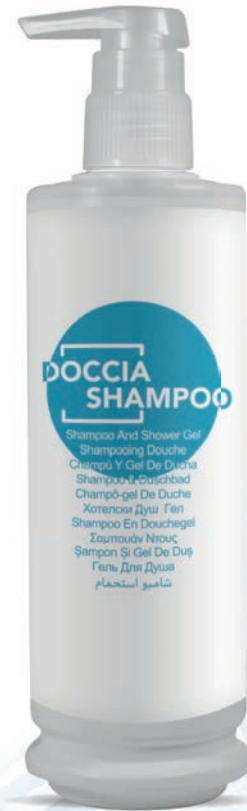
340 ml - 11.49 fl.oz. WHDS300D

يزيح الإجهاد اليومي بعيداً، ويمتخ الإسترخاء بعد عناء يوم من العمل.