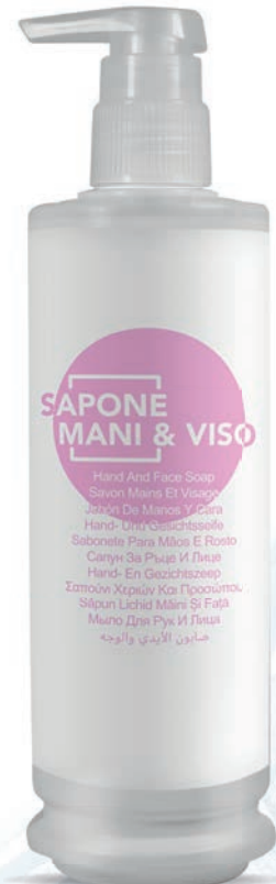
340 ml - 11.49 fl.oz. WHSM300D

أنه يحتوي على المادة الفعالة ، التطهير والناعمة التي تنظف البشرة وتحميها رائحة عطرية طويلة الأمد صمم ليكون موزع كئذء وكئي ويساعد البيئة في خفض النفايات البب سببكية