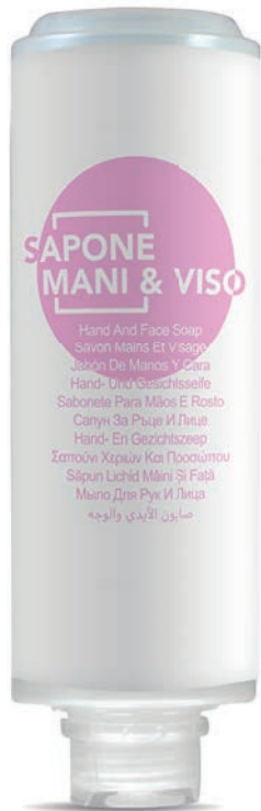
300 ml - 10.1 fl.oz. WHSM300F