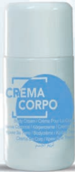
20 ml - 0,68 fl.oz. WHCC20F