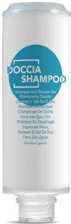
300 ml - 10.1 fl.oz. WHDS300F