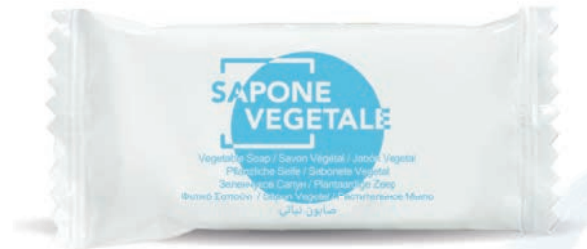
14 g WHSR14FP