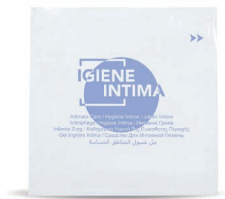
10 ml - 0.33 fl.oz. WHIG10