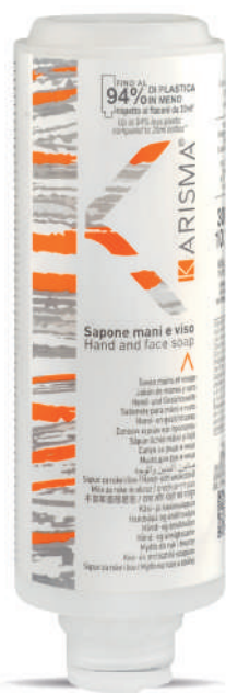
KRSH300C - 300 ml