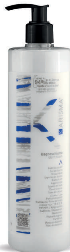
KRBS500D - 500 ml