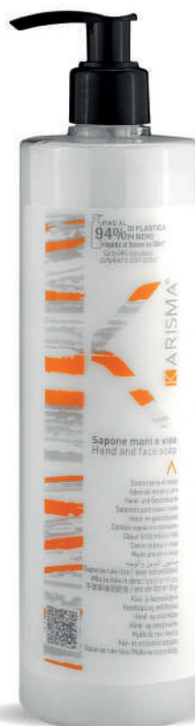
KRSM500D - 500 ml