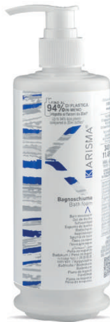
KRBS340D - 340 ml