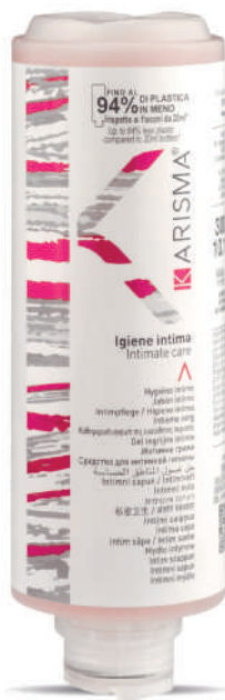
KRIG300C - 300 ml