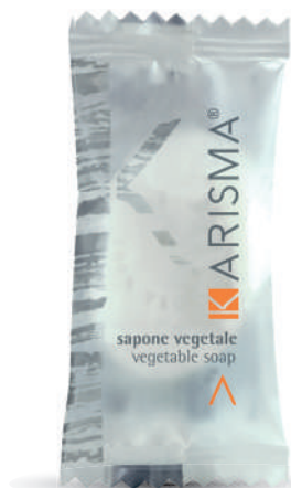
KRS09FP - 9 g