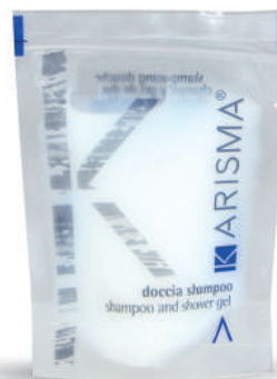
KRDS20 - 20 ml