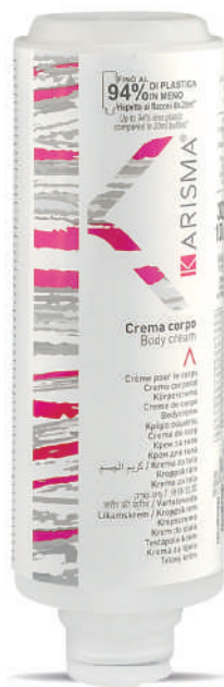
KRCC300C - 300 ml