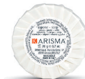
KRSP20PL - 20 g