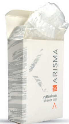
KRCDFP - Flowpack