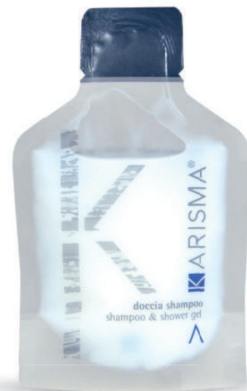
KRDS30 - 30 ml