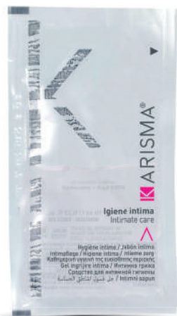
KRIG10 - 10 ml