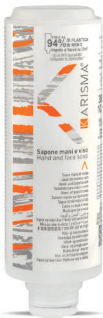
KRSM300C - 300 ml