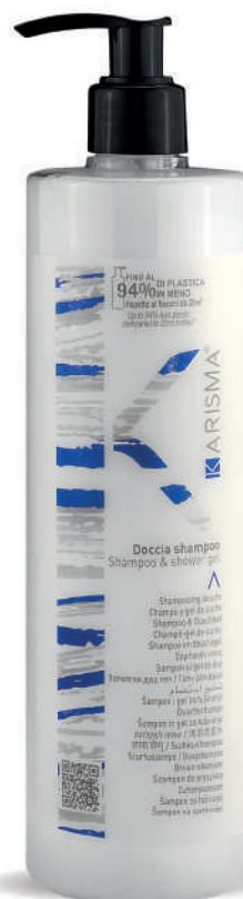
KRDS500D - 500 ml