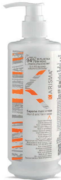
KRSH340D - 340 ml