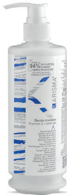
KRDS340D - 340 ml