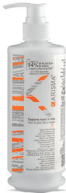
KRSM340D - 340 ml