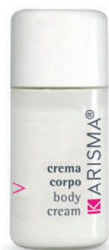
KRCC20F - 20 ml