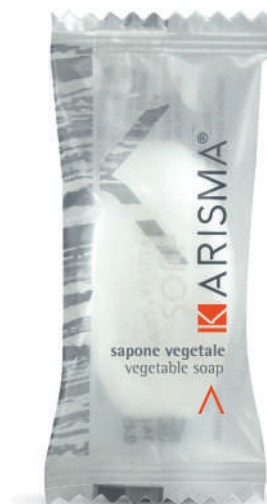
KRSR14FP - 14 g