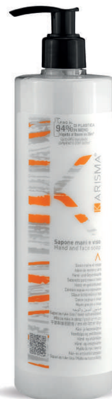
KRSH500D - 500 ml