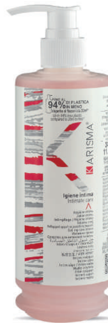
KRIG340D - 340 ml