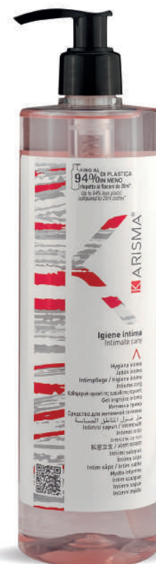
KRIG500D - 500 ml