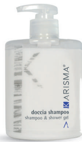
KRDS500F - 500 ml