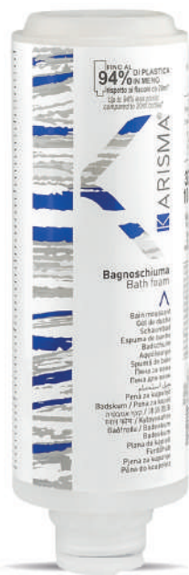
KRBS300C - 300 ml